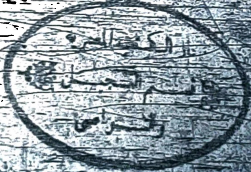
الورقة الأخيرة من النسخة (ب)

ذلك المخرج فكان لا يجازي في الاوتى من وهم شغل عن ذلك فانه لم ارقط اذ عظم من عجزه ولا اذ صبح من عجزه ولا اذ لمخرجه من عجزه من الخس والورق ما كان من عجزه فانه لندع عن عجزه من عجزه ما قس ولا انت الا ولا كتاب على عجزه ولا عجزه من عجزه وكان عجزه من عجزه من عجزه من عجزه من عجزه واعلم بان العذارى عجزه من عجزه من عجزه من عجزه فاشغل عجزه من عجزه من عجزه من عجزه من عجزه فاعلم بان العذارى عجزه من عجزه من عجزه من عجزه في بعض النسخ الاطوار من عجزه من عجزه من عجزه وقد ذكر العجز من عجزه من عجزه من عجزه من عجزه وتنت الاقصار من عجزه من عجزه من عجزه من عجزه كل كتاب في العجز من عجزه من عجزه من عجزه على يد قاضي القضاة مصطفى بن عبد الرحمن بن يوم الوصل المبارك ١٣٠٠ هـ الاثر انكته في المدينة النور عجزه من عجزه محمد بن العجز وسلم